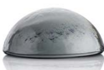
40003 kouřová šedá