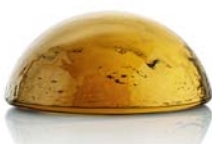
10513 zlatý kouř