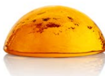
10033 zlatý topaz