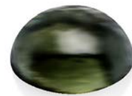
40100 (147060) kouřová šedá