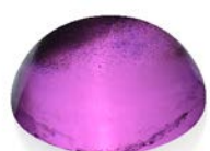
70550 (147084) rubinit