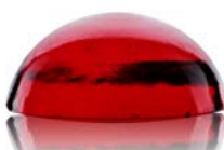
90031 topaz rubínový