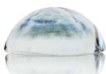
00031 křišťál | nestandard