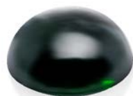
50030 (147054) olivín