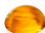
10020 (147064) zlatý topas

Vyobrazené barvy se mohou lišit od originálu.