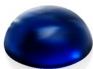
60030 (147044) akvamarín