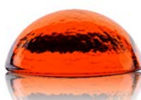
10040 zlatý topaz