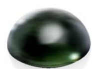
40100 (147058) kouřová šedá