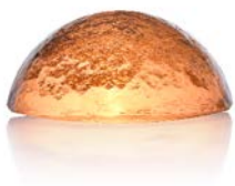
70723 (147026, 147028) meruňková