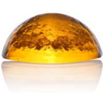
10030 (147068) zlatý topas