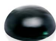
40000 (147056) kouřová šedá