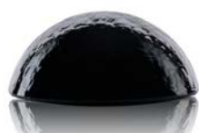
40100 kouřová šedá