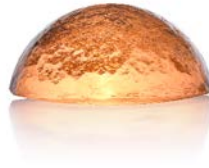
70720 (147070, 147072) meruňková