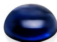
60350 (147052) safír siamský